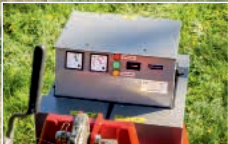
Anzeigen vom Traktor aus gesehen