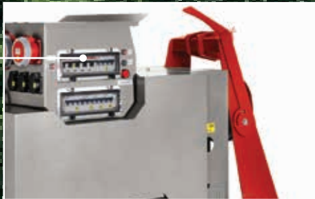
Einspeisesteckdose CEE 400V