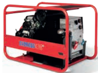
ESE 1006 SDHS-DC ES