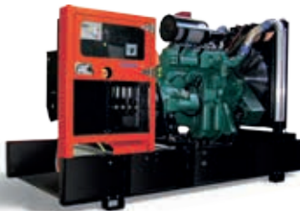
ESE 415 VW