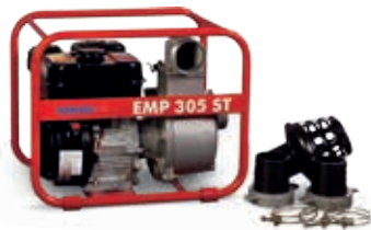
EMP 305 ST