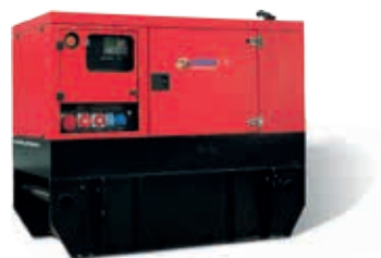
Großtank / Large Tank