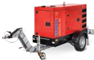
Fahrgestell / Trailer