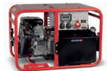
ESE 1006 DBS-GT