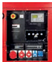
Schalttafel inkl. Steckdosenkombination Control panel incl. Socket combination