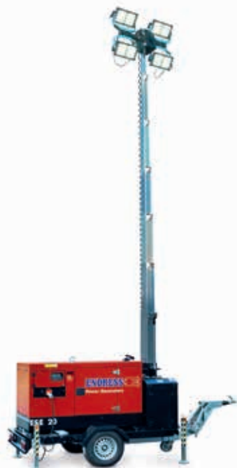
EFA 900 S4