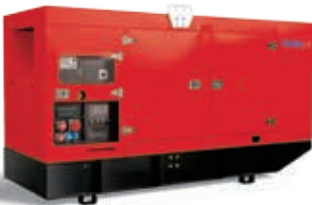
ESE 330 VW/AS