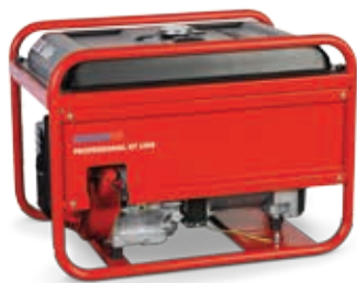
ESE 606 DHS-GT