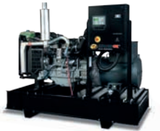
ESE 110 PW