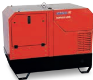
ESE 1408 DLG ES