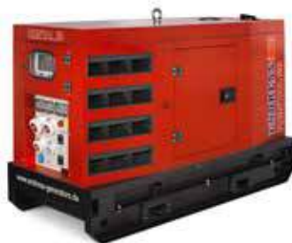
ESE 20 YW/RS