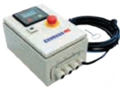
Notstromautomatik / AMF