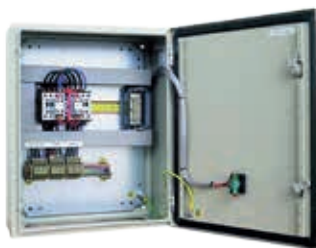
Umschalterschütze / Load transfer switch panel

(1) Motor fällt nicht unter die EU-Abgasregelung / Not under EC emission regulation.