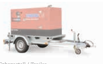
Fahrgestell / Trailer