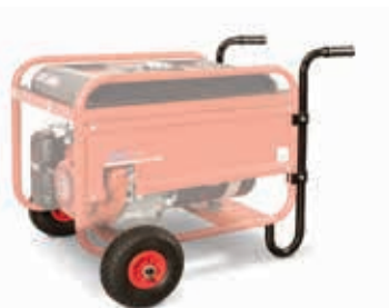
Radsatz / Wheel Kit