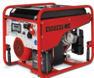
ESE 606 DHG-GT ES