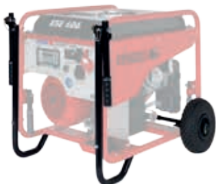
Radsatz / Wheel kit