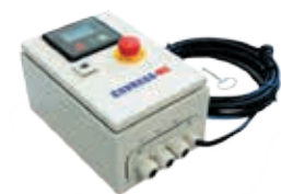
Notstromautomatik / AMF