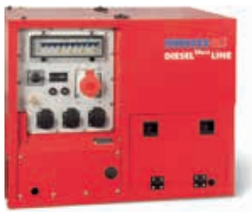
ESE 608 DHG ES DI