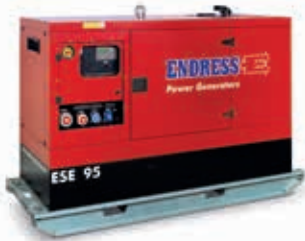
ESE 95 PW/MS auf galvanisierte Grundrahmen / with galvanized Baseframe