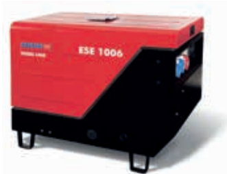
ESE 1006 DLS-GT ES ISO DI